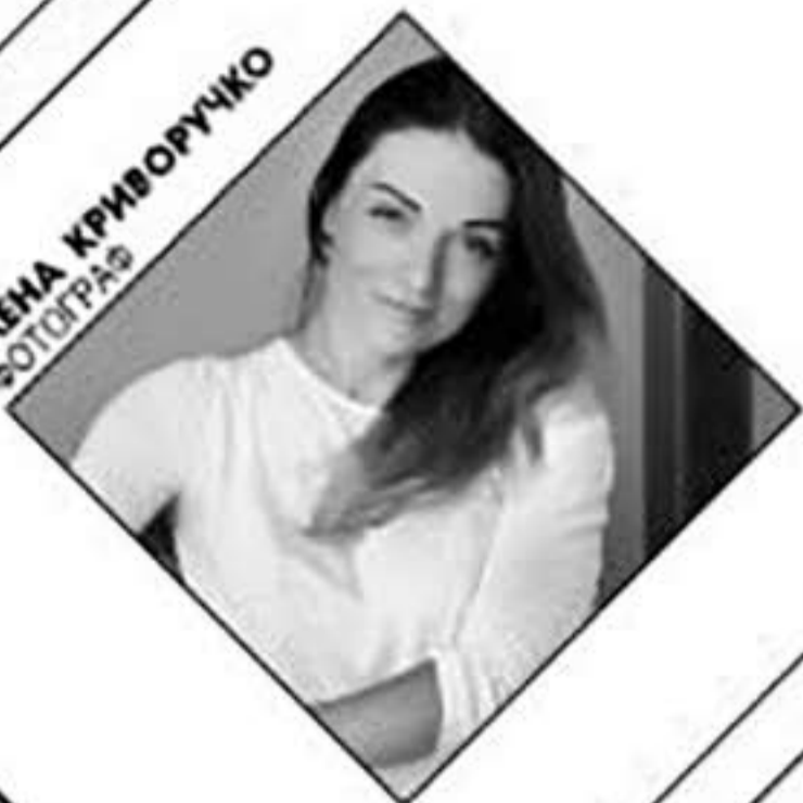
ЕЛЕНА КРИВОРУЧКО ФОТОГРАФ